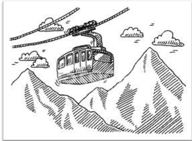
الشكل (د.د) : سكينش عن فكرة تسلق الجبال (الباحثان)